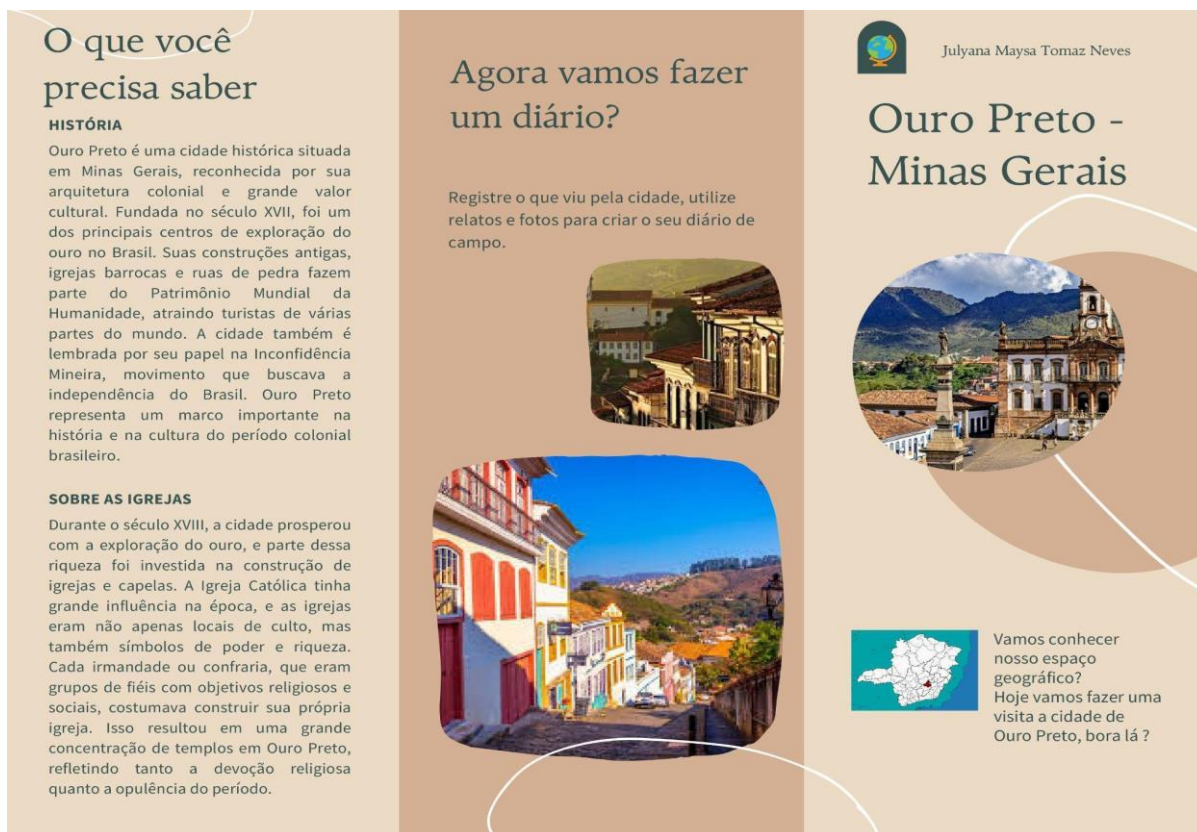
Figura 1 – Folder (frente) do roteiro de visita a cidade de Ouro Preto - MG

Elaboração: Julyana Maysa Tomaz Neves (2025)