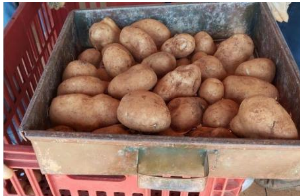
Figura 4 – Separação dos tubérculos por peneira

Para número e peso dos tubérculos graúdos, efetuou-se a classificação dos tubérculos por tamanho, utilizando-se uma peneira de aproximadamente 45 mm. Os tubérculos graúdos ficaram retidos nas peneiras, onde foram contabilizados, prontos para serem pesados para determinação de produtividade (Figura 4).