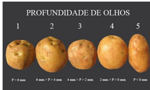
Figura 3 – Tabela de avaliação da profundidade de olhos