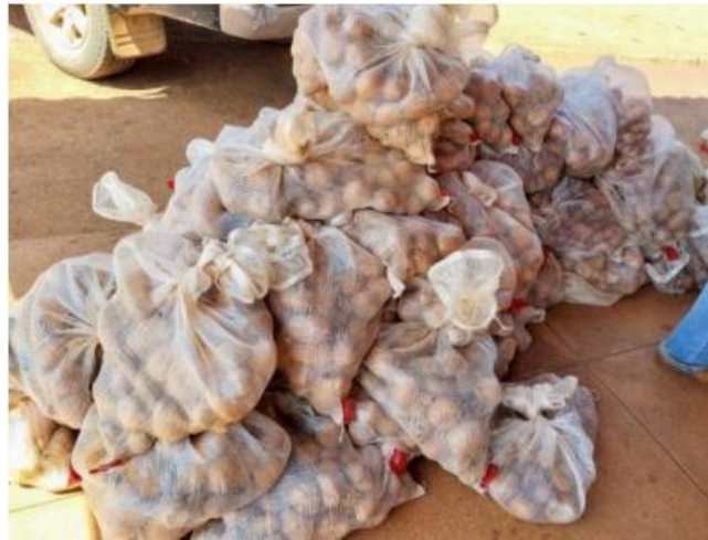
Figura 1 – Parcelas separadas e identificadas