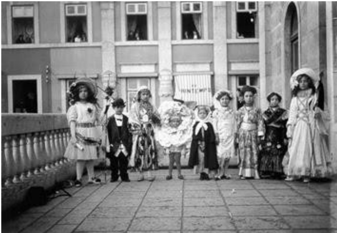
Figura 1- Crianças em baile infantil no início do século XX