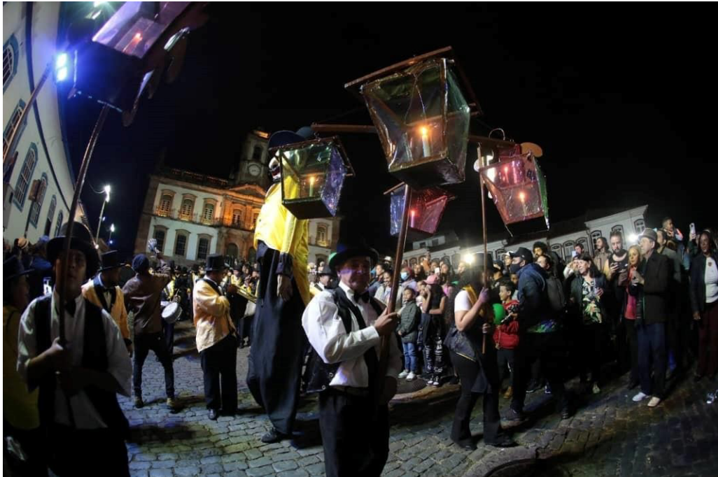
Figura 17 – Lanternas