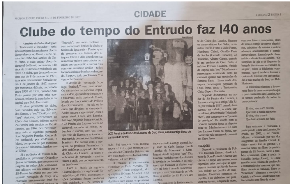
Figura 23 - club dos Lacaiois do tempo do Entrudo