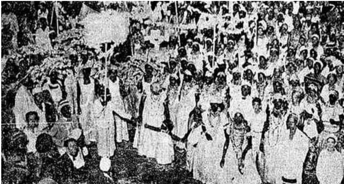
Figura 8 – Desfile da Portela em 1932, ainda intitulada Vai Como Pode