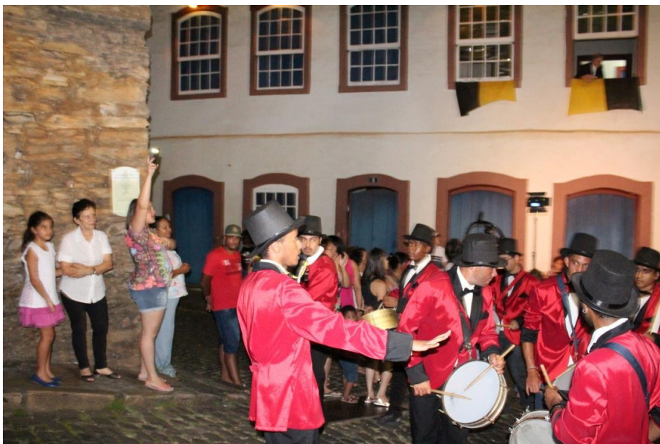
Figura 20 - Bateria do Zé Pereira

E por fim, mas não menos importante, vem a bateria (Figuras 20 e 21), que manteve o toque original desde suas origens.