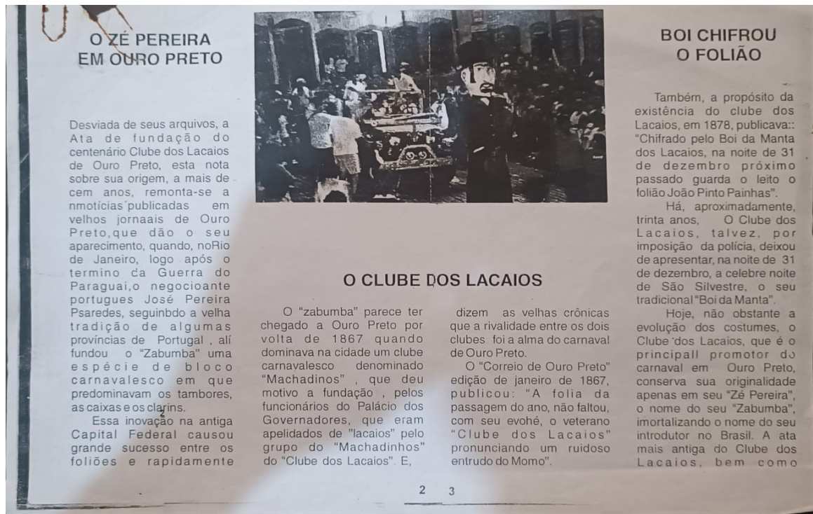
Figura 22 - Breve historia do Zé Pereira

A agremiação carnavalesca Zé Pereira do Clube dos Lacaiois tem uma influência significativa na identidade cultural de Ouro Preto. Fundada em 1867 (Figura 22), essa tradição secular não apenas preserva, mas também fortalece os valores históricos e culturais da cidade de forma única e vibrante. A cada carnaval, o desfile do Zé Pereira é aguardado com grande expectativa pelos moradores e visitantes, que se encantam com a riqueza dos trajes, a animação dos participantes e a música contagiante. Além disso, o Club do Tempo do Entrudo (Figura 23) ainda continua vivo na cultura da cidade, mantendo uma tradição que remonta aos primórdios do carnaval, quando as brincadeiras de rua eram a principal forma de celebração.