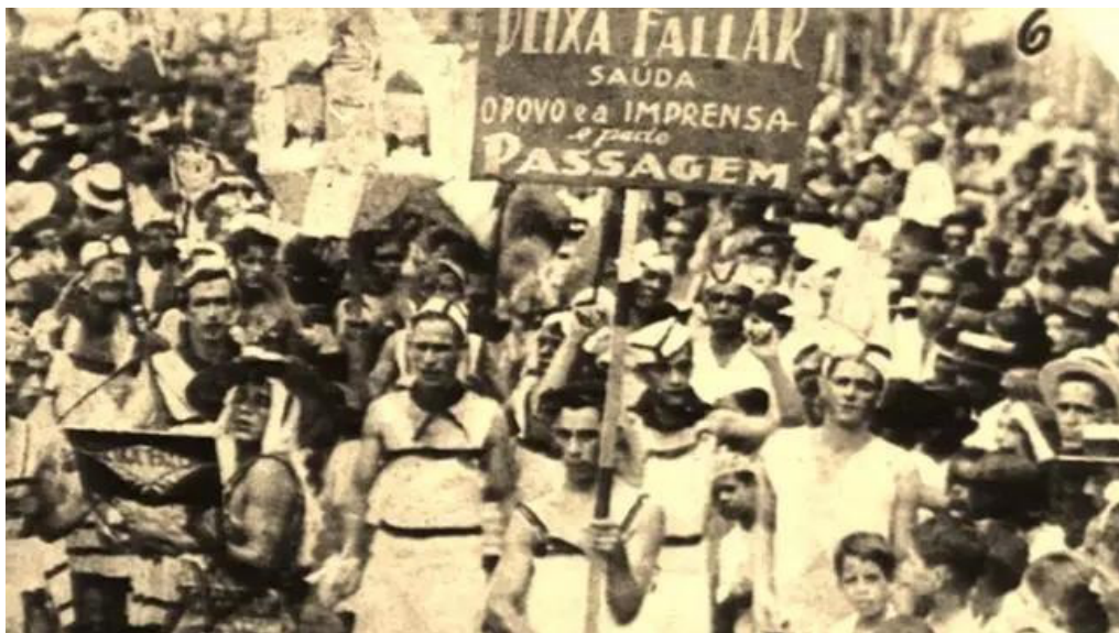
Figura 10 - "Deixa Falar", que anos depois se tornou "Estácio de Sá" foi a primeira escola de samba do país