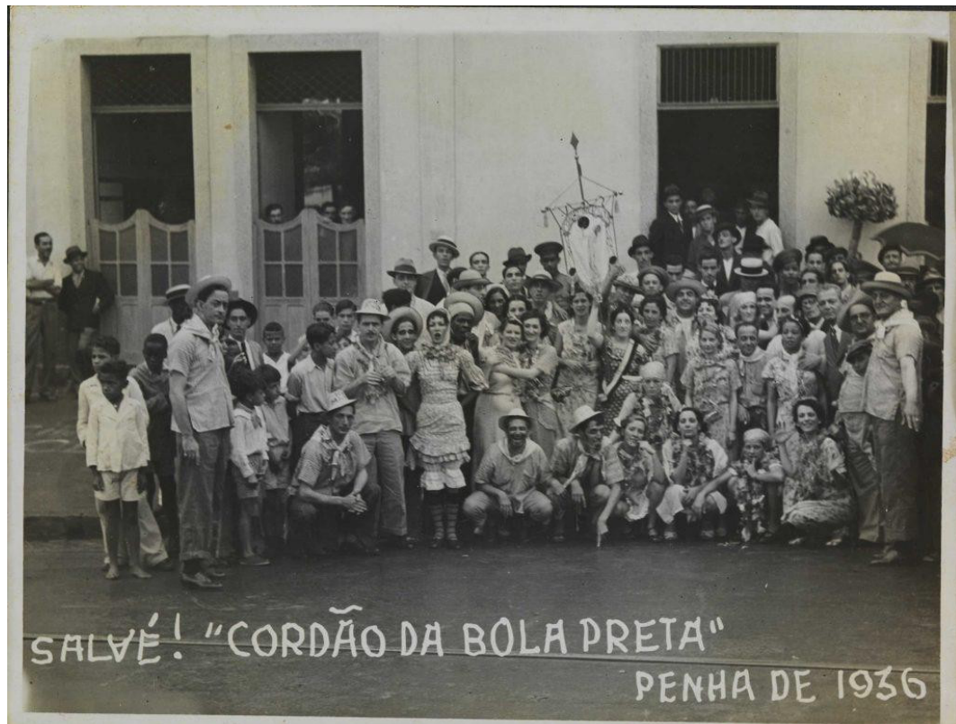
Figura 3 - Cordão da Bola Preta no Carnaval de 1936