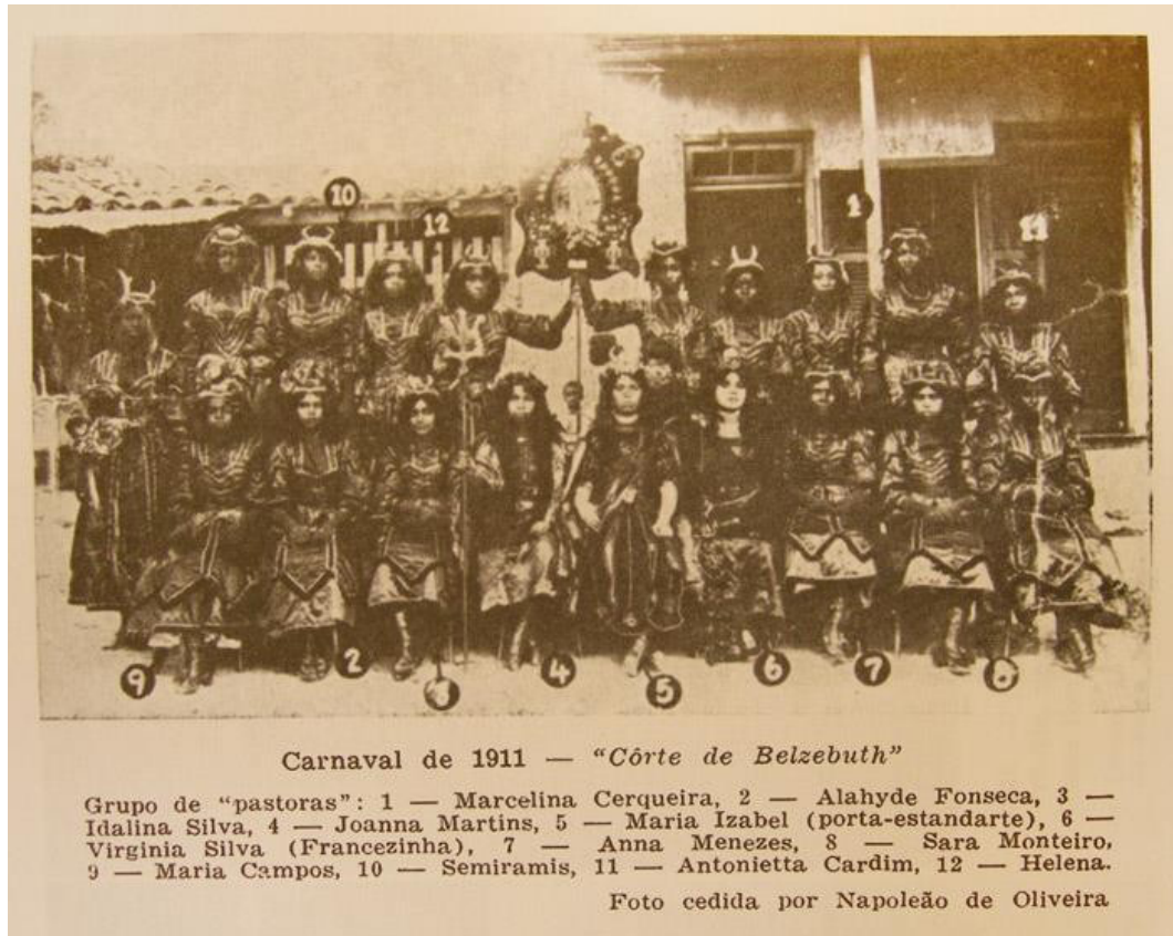
Figura 5 - O grupo de pastoras do rancho Ameno Resedá em 1911