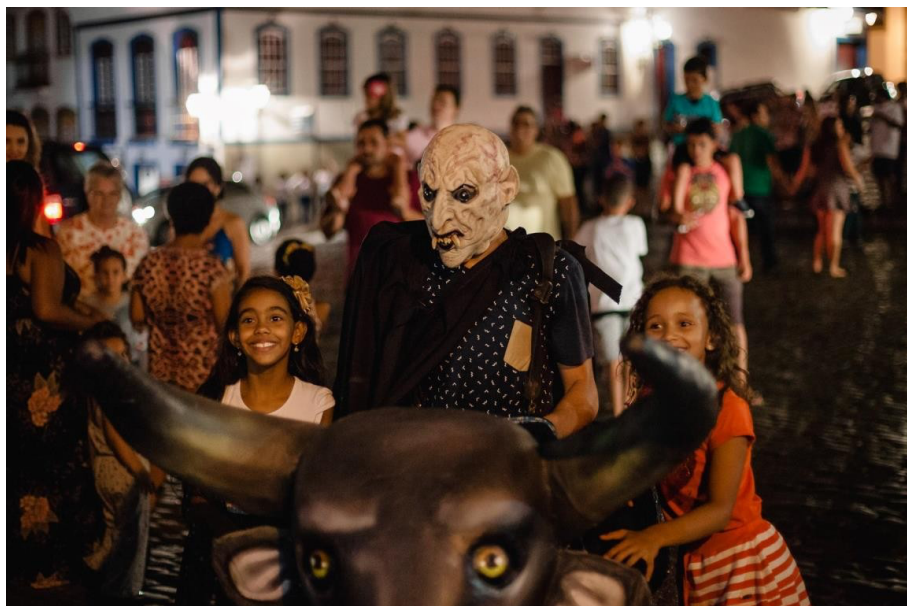
Figura 14 - Boi da Manta

Como visto na imagem do capítulo anterior (Figura 6), a formação do Zé Pereira era feita por uma guarda de honra montada em cima de cavalos, essa guarda de honra ia levando o estandarte. Atualmente a formação (Anexo B) mudou um pouco, hoje em dia não podemos mais sair com cavalos no carnaval devido a grande quantidade de pessoas na Praça Tiradentes. Na frente como abre alas vem o boi da manta (Figura 14).