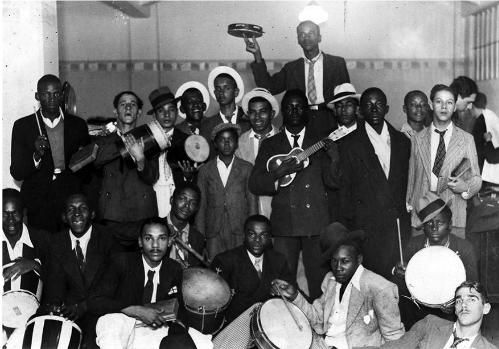
Figura 3 - Instrumentos como a cuíca, o surdo e o tamborim desceram o morro e se incorporaram ao carnaval de rua