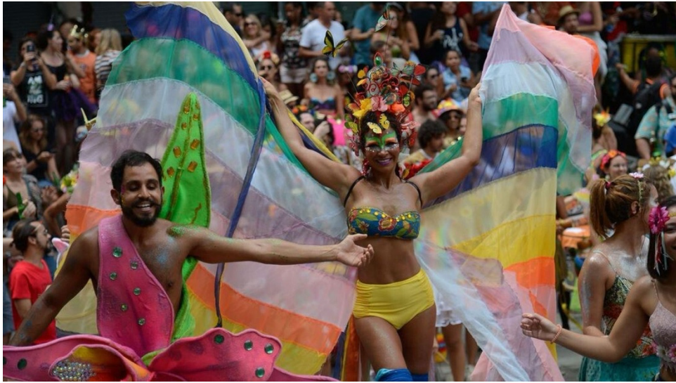
Figura 12 - Blocos carnavalescos durante a abertura não oficial do Carnaval do Rio em 2018