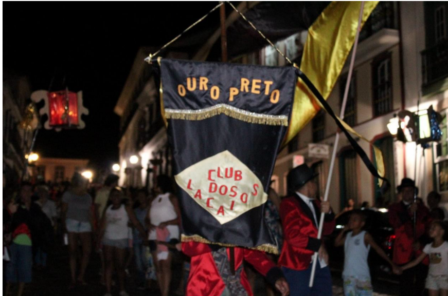
Figura 16 - Estandarte

Logo em seguida vem o estandarte (Figura 16), com as cores originais do club (preto e amarelo).