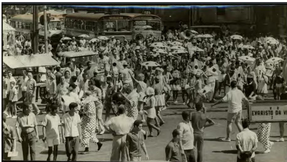
Figura 4 – Cordão do Bola Preta em desfile de 1969