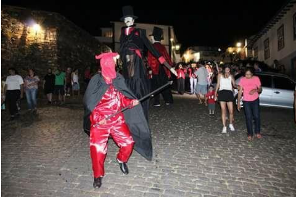
Figura 15 - Cariá