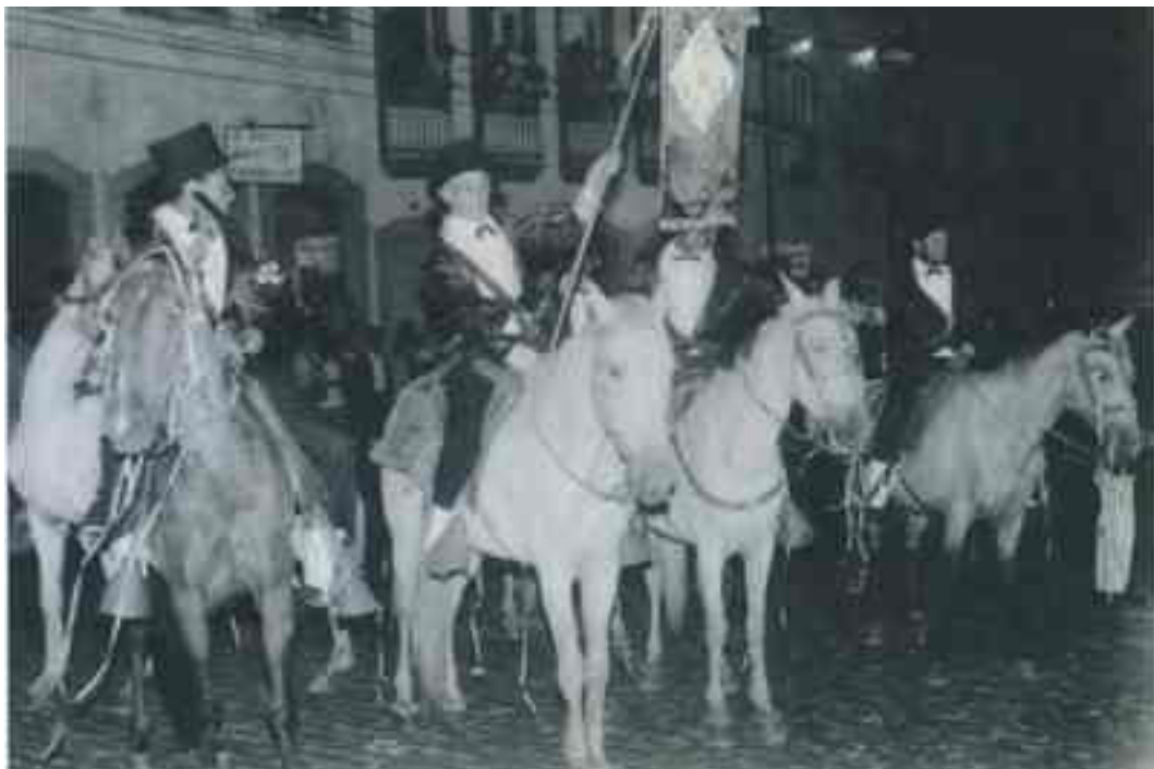
Figura 6 – Bloco Zé Pereira dos Lacaio- Ouro Preto