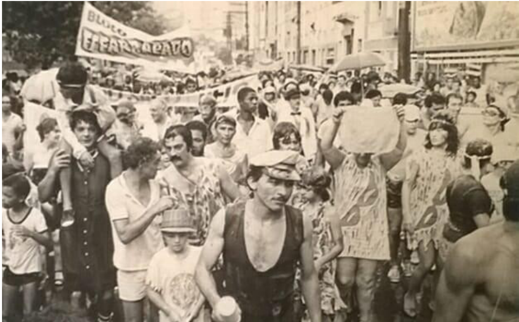
Figura 7 - O Esfarrapado de São Paulo