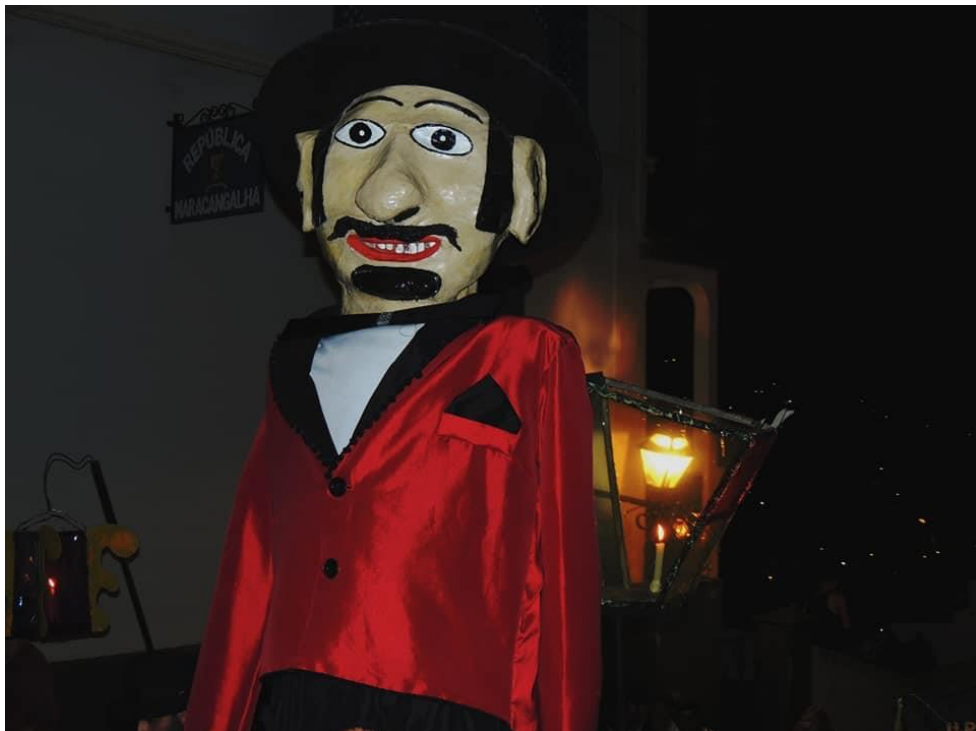
Figura 18 - Catitão

Logo após vêm os 3 bonecos originais do Zé Pereira, o Catitão, a Baiana e o Benedito (Figuras 18 e 19). O Catitão é o principal, ele representa a imagem do Zé Pereira.