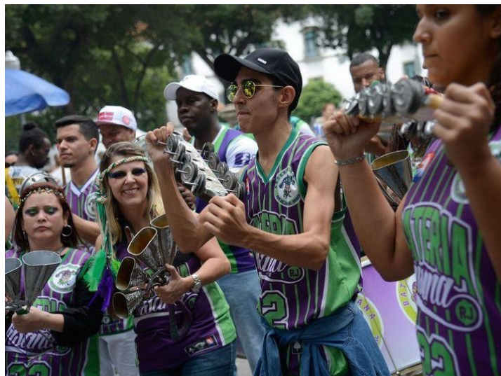
Figura 13 - Bateria de um bloco de rua no Carnaval de 2018 no Rio de Janeiro